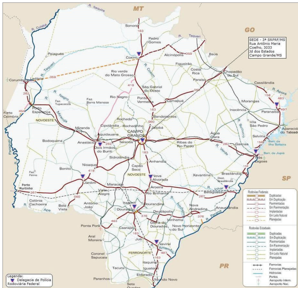
Figura 1 - Distribuição espacial das delegacias da SRPRF-MS

Dentro do âmbito da Polícia Rodoviária Federal, este estudo, mais especificamente tem como foco a Superintendência Regional da Polícia Rodoviária Federal no Mato Grosso do Sul, doravante identificada como (SRPRF-MS). A SRPRF-MS possui sede administrativa no município de Campo Grande (capital do estado). Criada em 1992, possuía, até julho de 2018, uma infraestrutura de dez delegacias, distribuídas no território do estado, conforme demonstrado na Fig. 1.