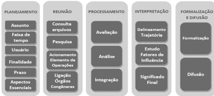
Figura 2: Metodologia para a produção do conhecimento