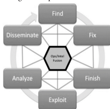
Figura 1: O processo F3EAD.

Graficamente, o processo metodológico F3EAD pode ser representado de modo interconectado, “assemelhado a uma teia” (FAINT; HARRIS, 2012, tradução nossa). No entorno, em ordem contínua, identificam-se seis etapas que a intitulam: Find , Fix , Finish , Exploit , Analyze e Disseminate . Ao centro, encontra-se a fusão funcional entre atividades de Inteligência e operações, conectada a todos os elementos do ciclo, como segue: