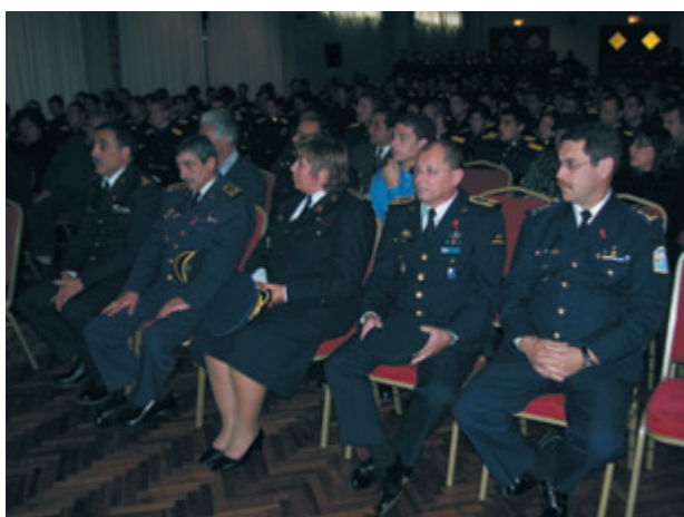
Conferencia dictada a Sres. Oficiales y Cuerpo de Cadetes

Desde los Servicios Uniformados Uruguayos tenemos el honor de representar al Ministerio del Interior, habiendo sido invitadas a participar de la Coalición, junto a la representante del Ministerio de Defensa Nacional, como Mujeres Líderes en la defensa de los derechos de las mujeres de vivir una vida libre de violencia y de riesgo de contraer VIH, y de compartir con otras líderes de América Latina nuestras experiencias exhortando a que desde los diferentes espacios de trabajo se tenga una participación cada vez más activa, como una obligación de ser la voz de aquellas mujeres que no la tienen, influyendo para evitar la proliferación del VIH.